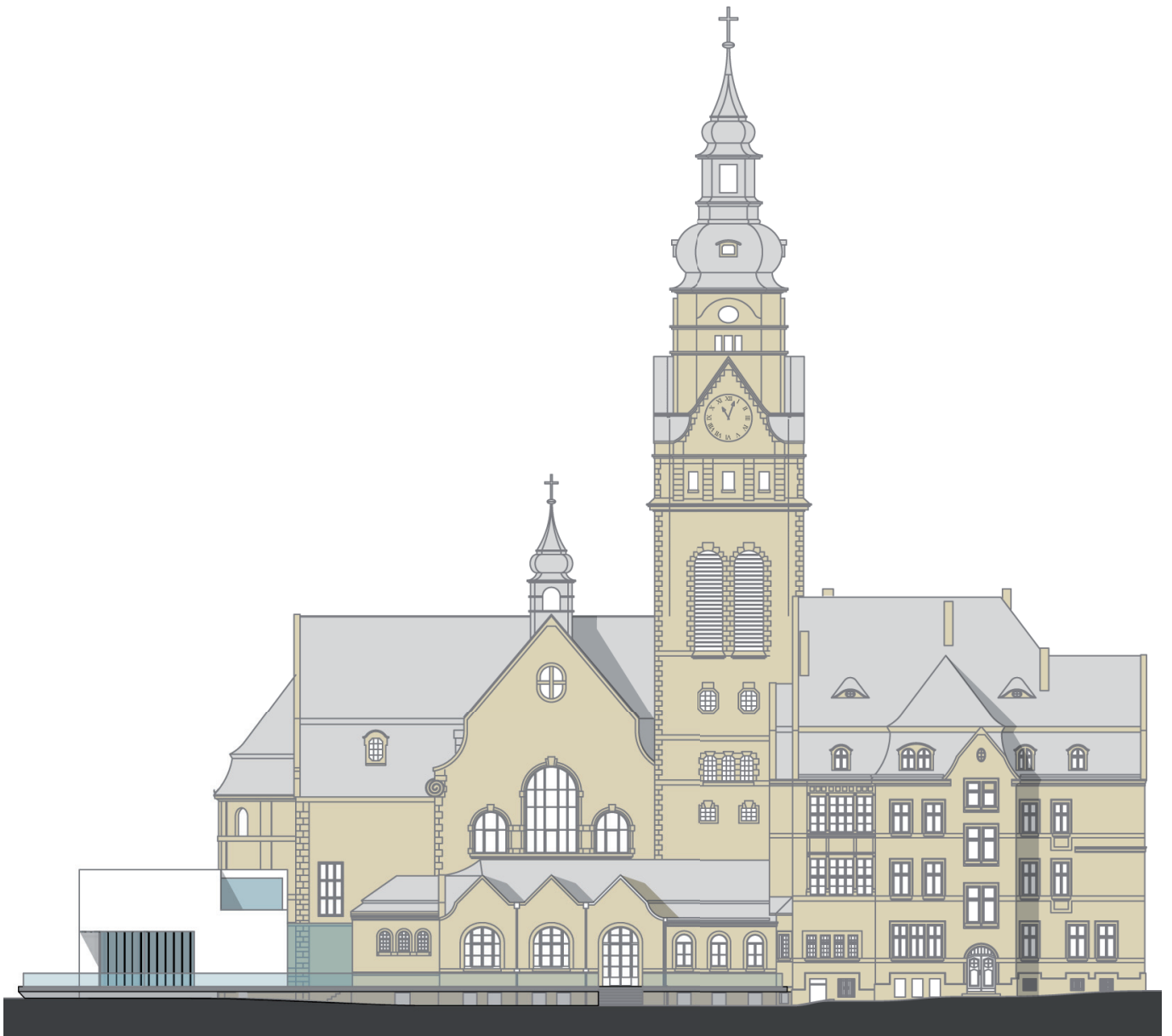
Abb.30 Südwestansicht mit Erweiterungsbau