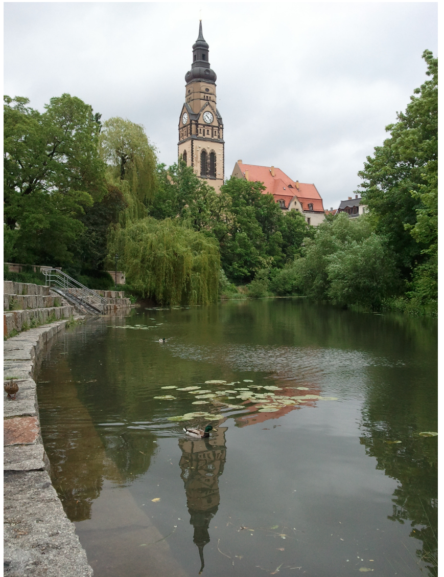
PHILIPPUSKIRCHE LEIPZIG - LINDENAU