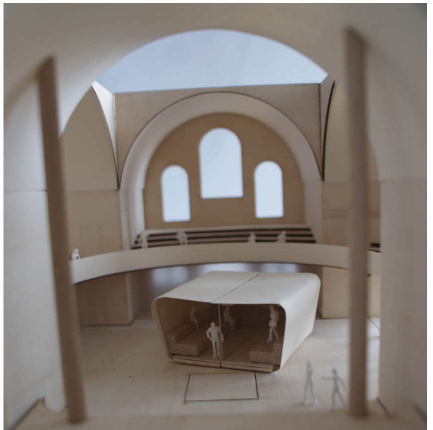
Abb.32 Veranstaltungsraum mit Einbauten