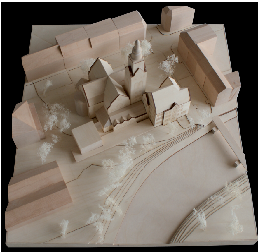
Abb.31 Ensemble mit Erweiterungsbau